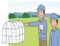
ハウス自力施工研修など技能習得