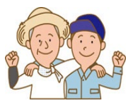
非常時の協力体制の構築