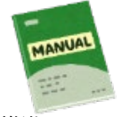
BCP推進マニュアルの策定