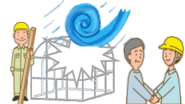
自力施工体制の活用等による災害復旧の取組実証