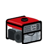
非常用電源の共同利用