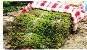
8月下旬～9月下旬 種セリの芽出し

種用のセリを刈り取ります。鮮やかな緑色であるか、病気にかかっていないかなどをチェックしながら採ります。