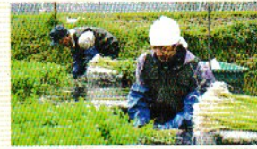
10月中旬～2月 根せり収穫

まいた間隔によって、成長する太さや長さが左右されるので種まきはコツがある作業です。