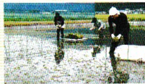
9月 種セリのまきつけ

水を張って土を細かく砕き、丁寧にかけ混ぜながら、土の表面を平らにする作業です。種セリの活着と発育をよくするためにいきます。