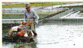
9月 代掻き(しろかき)

日影の涼しい場所に種セリを並べます。8日～10日間、この状態で寝かせ、節から芽を出させます。