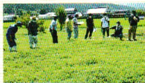
8月中旬 種セリの現地検討会

セリの取り残しや雑草を取り除き、土に肥料を混ぜ耕します。水深を確保するため、畦畔(けいはん)にアセシントを張り巡らすのが特徴です。