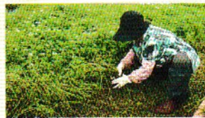
8月下旬～9月下旬 種セリの採取

セリ田は収穫用のほかに、種としてのセリを育てる種田があります。種用のセリが病気や害虫に負けず育っているか、全ての種田を生産者が確認します。