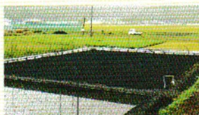
6月下旬～9月 セリ田の準備

旧河北町飯野川地区で江戸時代から栽培され続ける「河北せり」をご紹介します。土づくりから収穫・調整まで、機械化することなく、手作業で丁寧に育てられています。