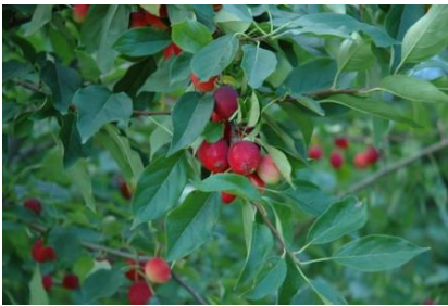
図 1 Dolgo Crab