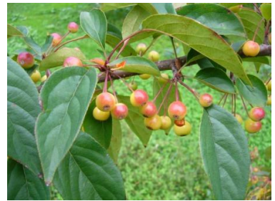
図 3 Eley Purple Crab