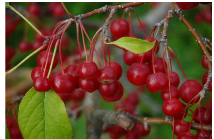
図 10 David Crab