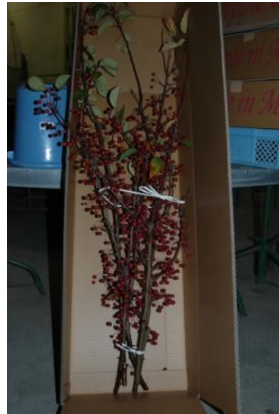
図 14 Redbud Crab の実付き枝物