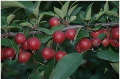
図 4 Makamik Crab