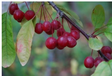
図 9 Adams Crab