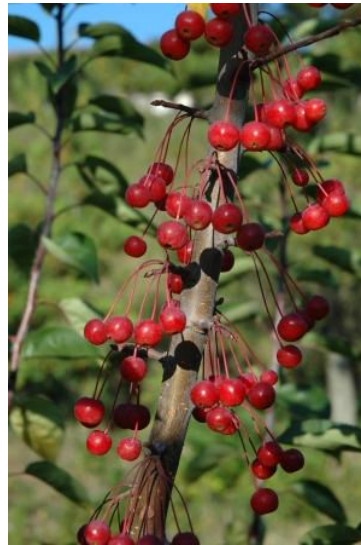
図 12 Redbud Crab