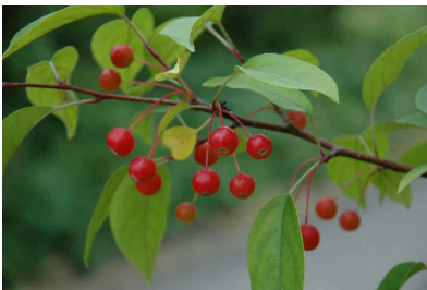
図 7 Snowdrift Crab