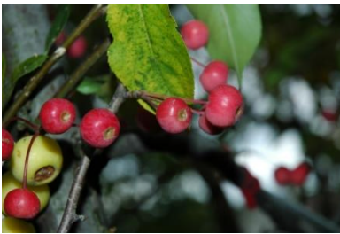
図 5 American Beauty