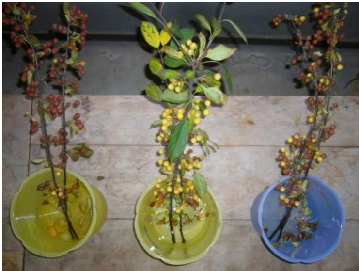
図 16 鮮度保持剤が観賞期間に及ぼす影響