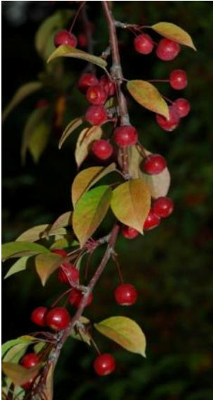
図 8 Red Splendor Crab