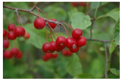
図 6 Beverly Crab