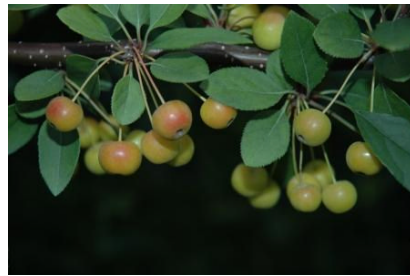
図 2 Ormiston Roy Crab