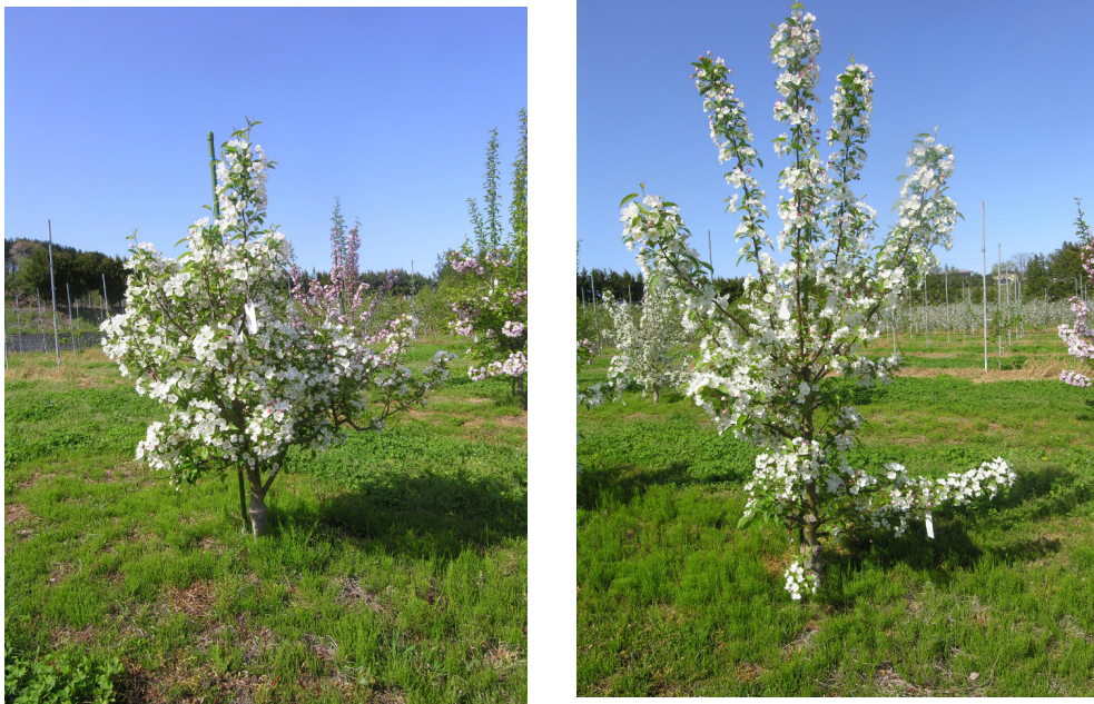
図3 クラブリンゴ「Snowdrift Crab」の開花状況（左図：落花後剪定、右図：休眠期剪定）