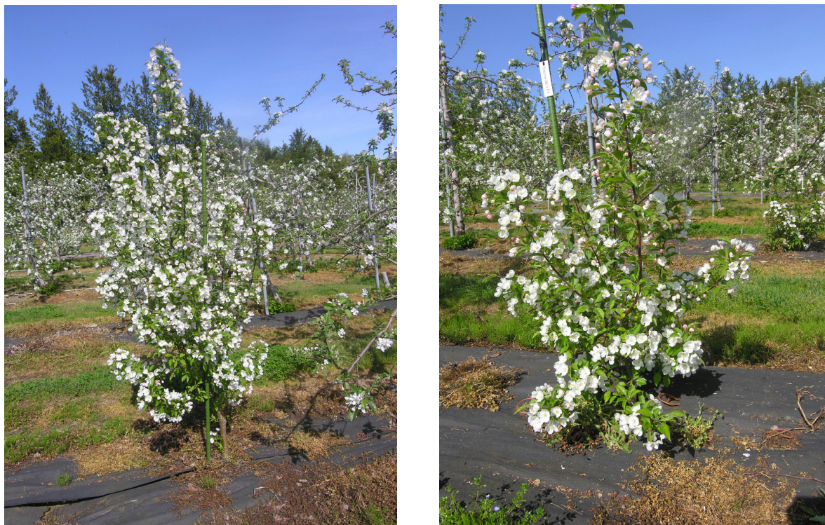
図4 クラブリンゴ「Snowdrift Crab」の開花状況（左図：主幹型、右図：短幹型）